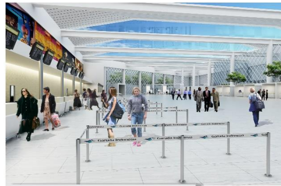
Check in counter